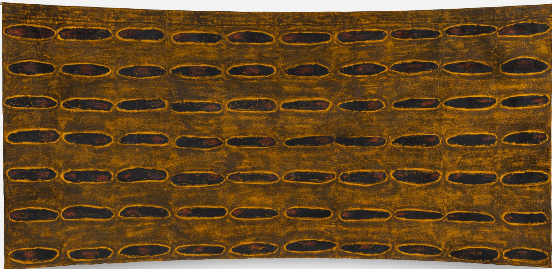
Antítese do tempo (tymbaba) 2026 Giz pastel oleoso sobre lona 140x300cm