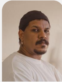
Carpina, Brasil, 1996